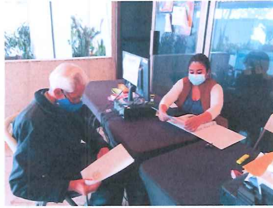
Ordenando la papelería