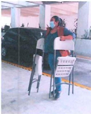
Trasladando el equipo

Se apoyó trasladando las mesas con los equipos de lunes a jueves a la entrada de la galería y solicitando que la puerta fuese cerrada con llave, los días viernes se apoyó en el desmontaje del equipo de computación, las mesas y útiles para dejarlos en el salón de resguardo para ser instalados el día lunes.