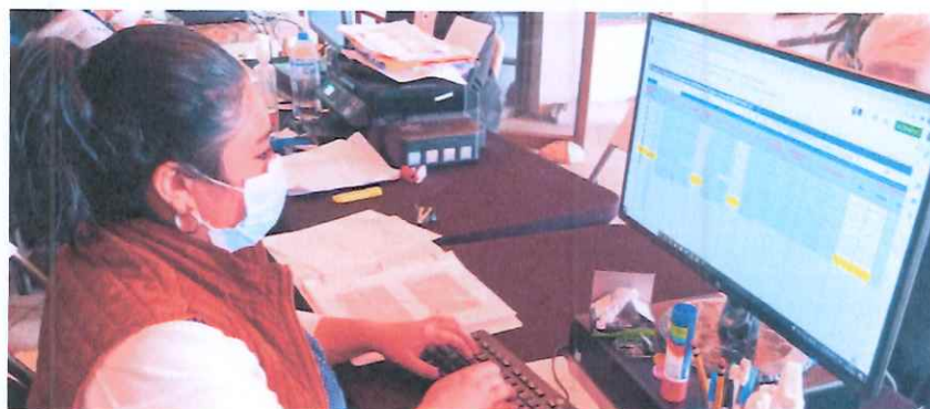
Traslado de maestros aprobados

Se apoyó a trasladar a los artistas que cumplían con todos los requisitos y fueron aprobados; al programa Run, su número de convenio, si en caso fuera que el maestro debía ampliar su documentación se anota en un listado adjuntando la observación.