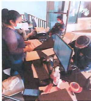
Apoyando a un maestro a llenar el formulario para registrar cuenta bancaria

Se apoyó a los artistas buscando videos, fotografías en las redes sociales o si en caso no tenían acceso a una red proporcionar a donde podían anclar sus dispositivos móviles o si no conectándolos a bluetooth así poder imprimir los documentos en dicho caso sus fotografías, inventario de cuentas. Fotocopiar documentos originales y documentos de identificación.